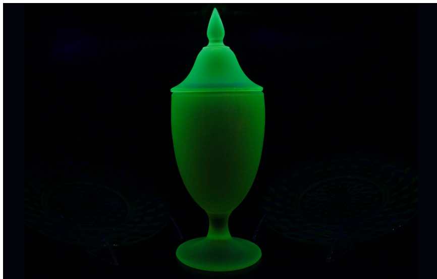
Cara Despain, under the rainbow, behind the curtain (2022), madera, vidrio antiguo de la Depresión y luces UV.

Sitio de Pruebas de Nevada — situado a tan solo 65 millas de Las Vegas y a menos de 150 millas del lugar en donde nacieron y crecieron su madre y su abuela — y fueron investigadas detalladamente por Despain para captar las implicaciones de largo alcance del legado de las pruebas nucleares.