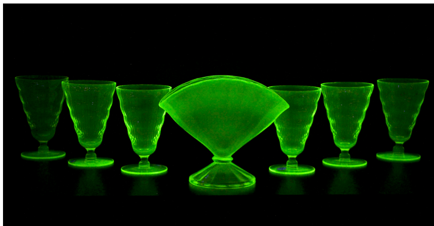
Cara Despain, under the rainbow, behind the curtain (2022), madera, vidrio antiguo de la Depresión y luces UV. Cortesía de la artista. Crédito de la foto: Cara Despain.

La fantasmagórica y cinematográfica puesta en escena de esta exposición proporciona un contexto histórico y un inquietante recordatorio de historias oscuras e injusticias enterradas en el legado de la Guerra Fría. Despain comparte: "Specter es una mirada a la conexión compartida casi espiritual, de otro mundo, oscura, que literalmente irradió desde el día en que hicimos las primeras pruebas y que sigue persiguiendo los cuerpos de todos los seres vivos del planeta." La atmósfera que generan las obras en Specter es un monumento al momento histórico en el cual embarcamos nuestro camino irreversible hacia el Antropoceno y hacia una era nuclear que sigue empujándonos a un precipicio existencial.