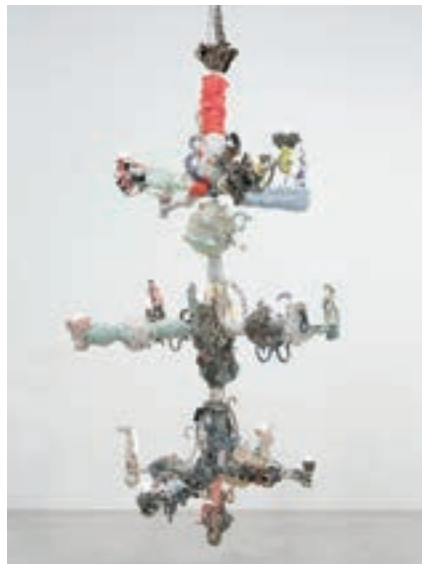
Francesca DiMattio, Chandelabra II , 2015. Esmalte y lustre en porcelana y arcilla, resina epoxi y estructura de acero, 120 × 96 × 96 in. Colección de The Bass. Donación de la artista.