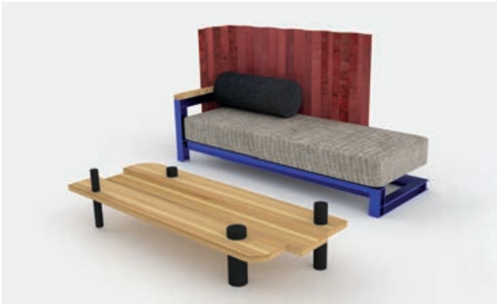
Emmett Moore, Exploded View: Coconut , 2023. Aluminio, acero corrugado, pino del Condado de Dade, espuma de poliestireno expandido, concreto, tapizado y herrajes. Dimensiones variables.